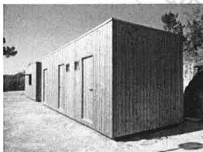
Obs. Imagem meramente ilustrativa