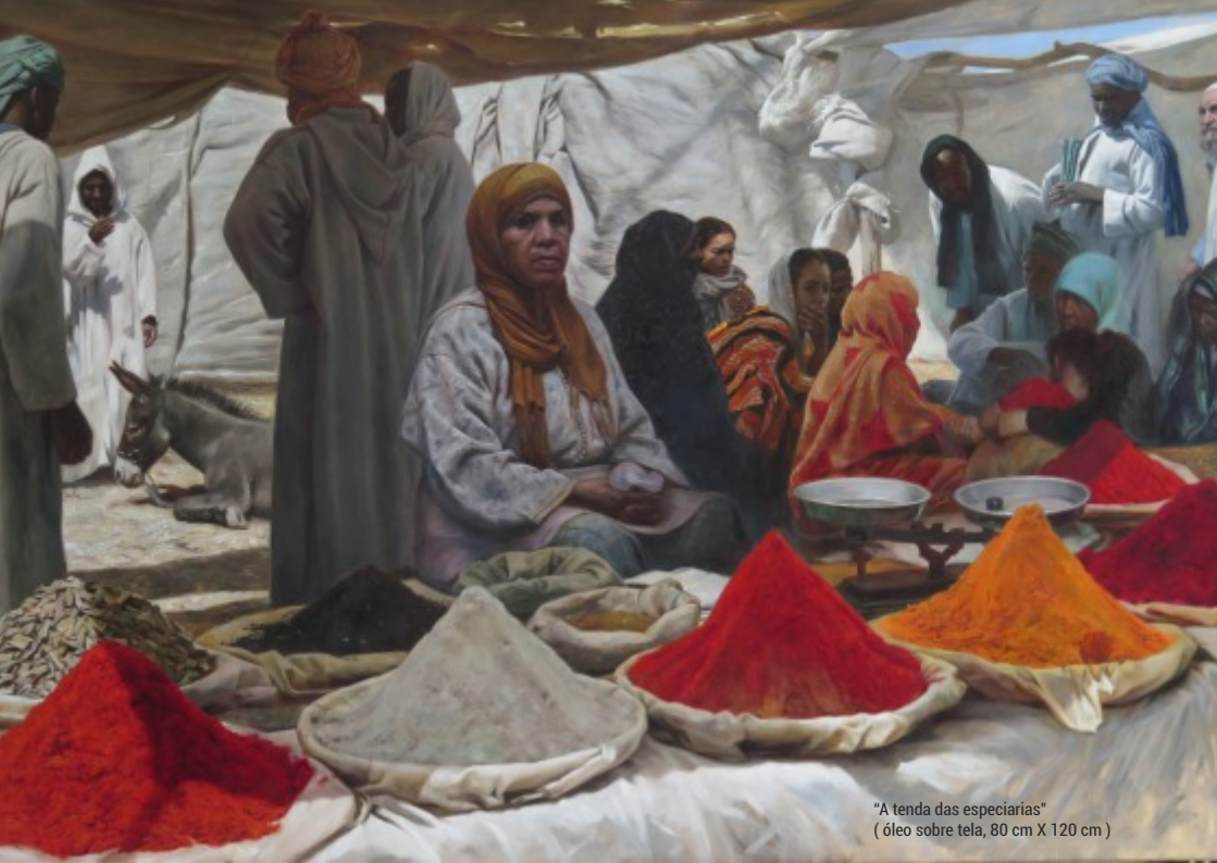
"A tenda das especiarias" ( óleo sobre tela, 80 cm X 120 cm )