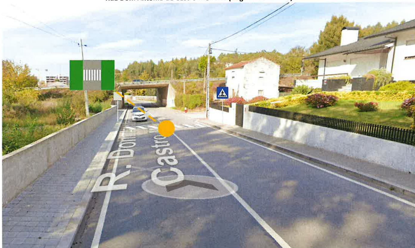
Marcação no pavimento da marca M11 – Passagem para peões (1 marcação)

Rua Dom António de Castro Meireles (Baguim do Monte)