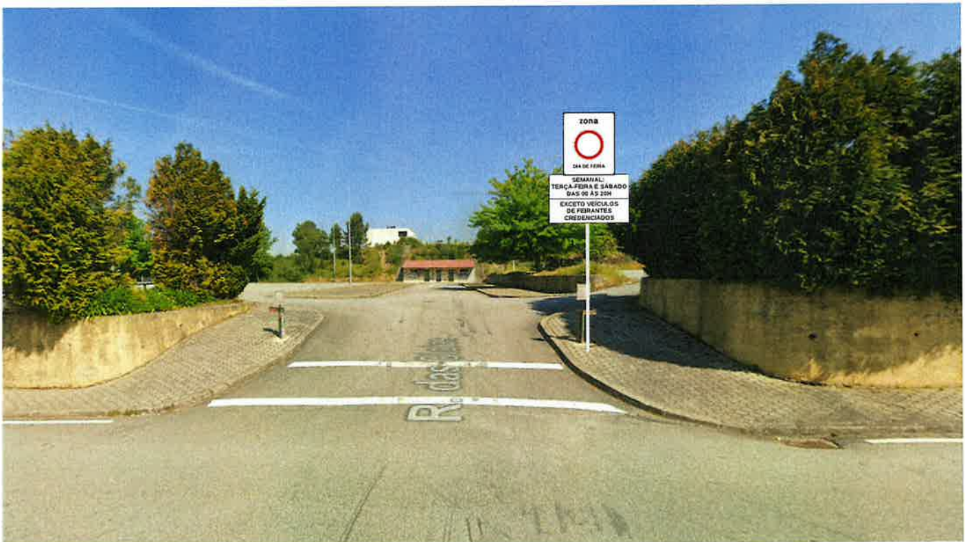
Feira de São Pedro da Cova Rua da Associação Desportiva de São Pedro da Cova (São Pedro da Cova)