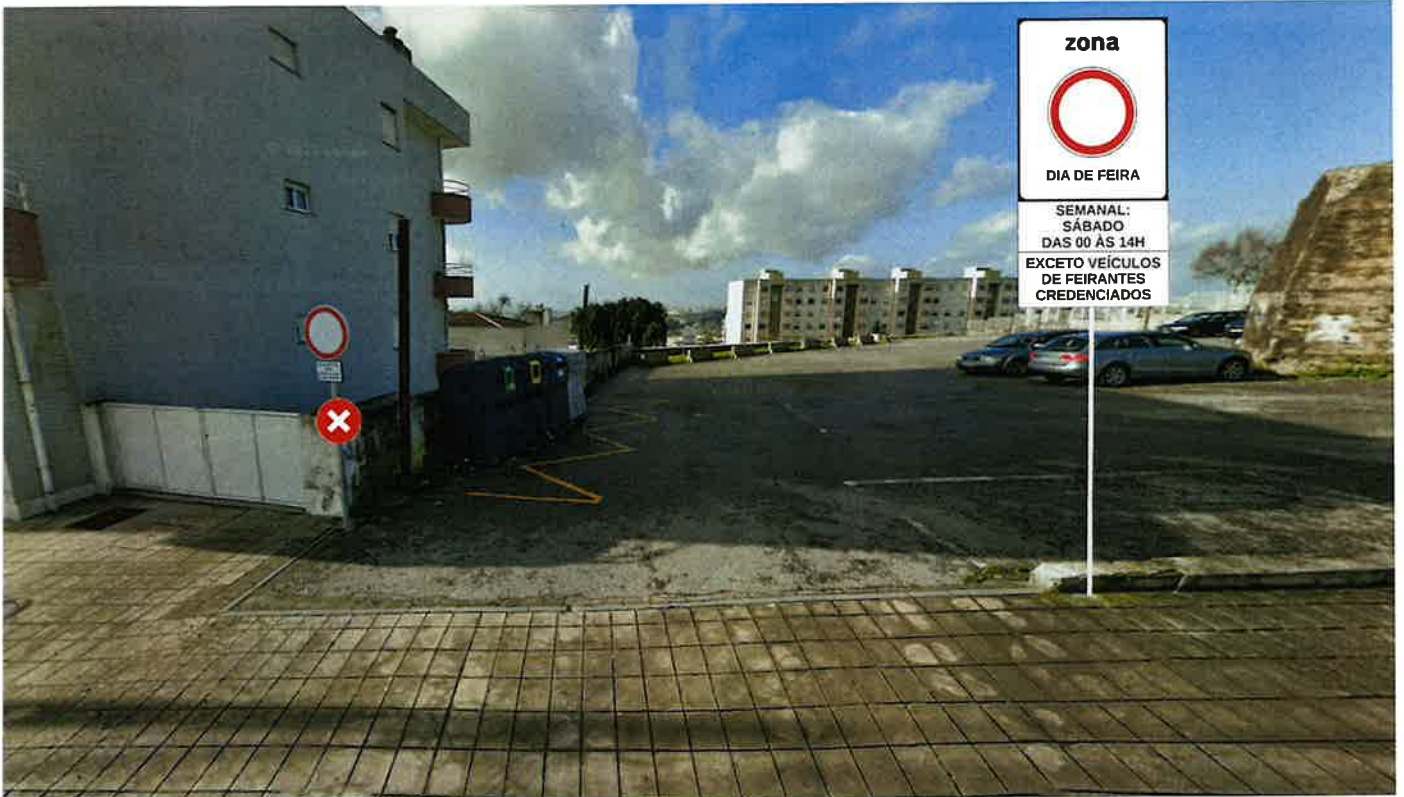
Feira da Bela Vista Estrada Dom Miguel (Fânzeres)