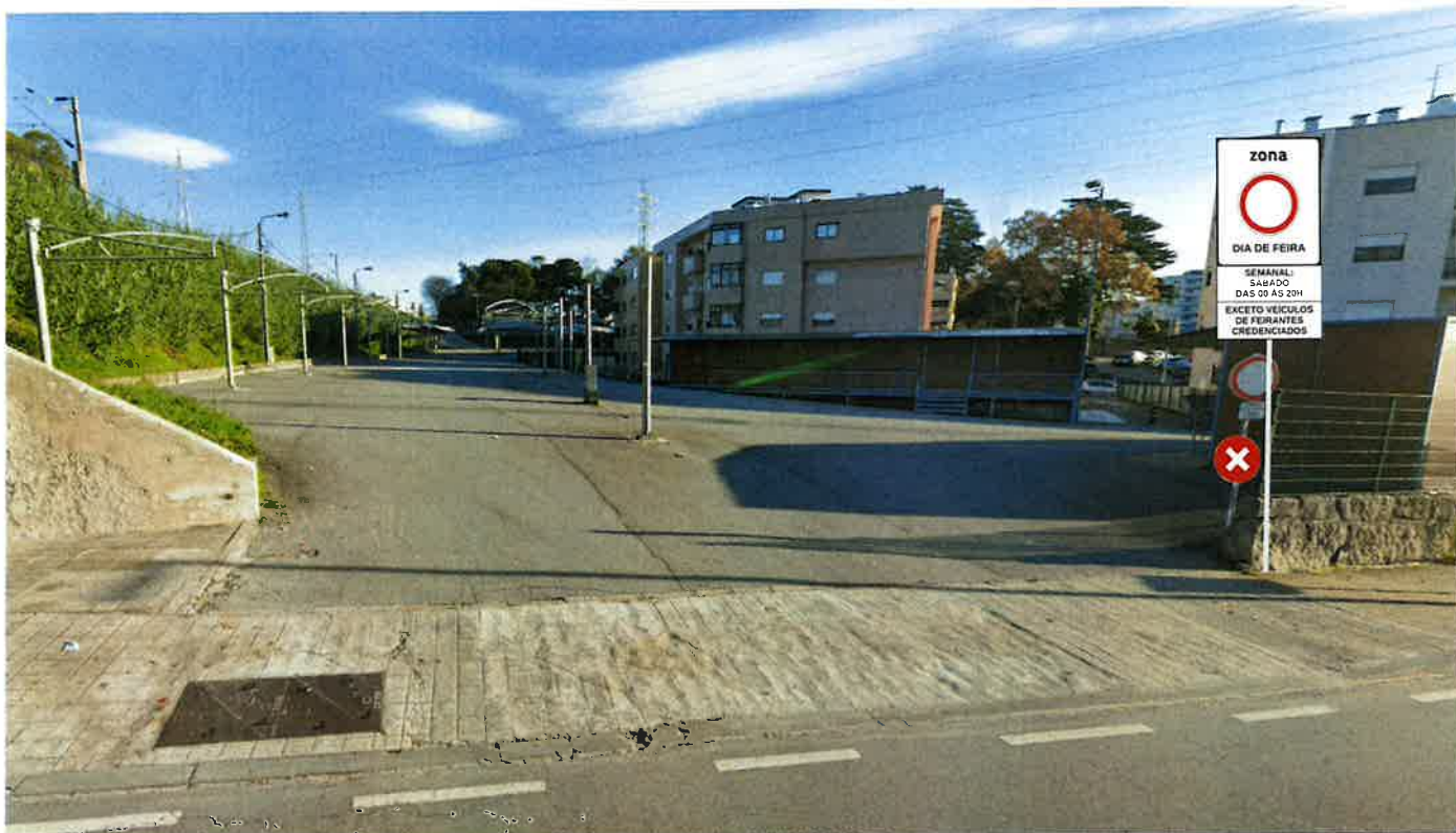
Feira de Rio Tinto Avenida Doutor Francisco Sá Carneiro (Rio Tinto)

Avenida Doutor Francisco Sá Carneiro (Rio Tinto) + Avenida Multiusos | Gondomar (São Cosme) Planta nº 2