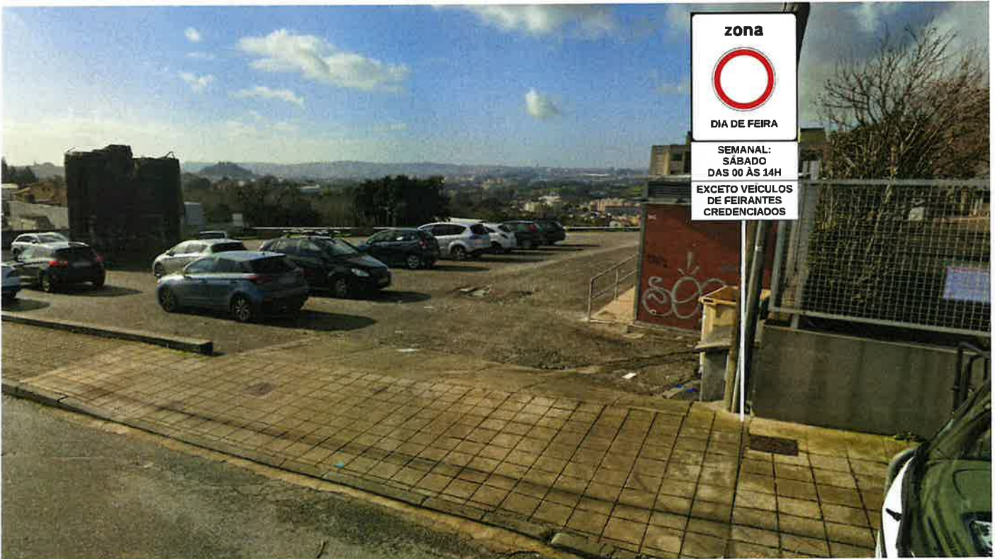
Feira da Bela Vista Estrada Dom Miguel (Fânzeres)