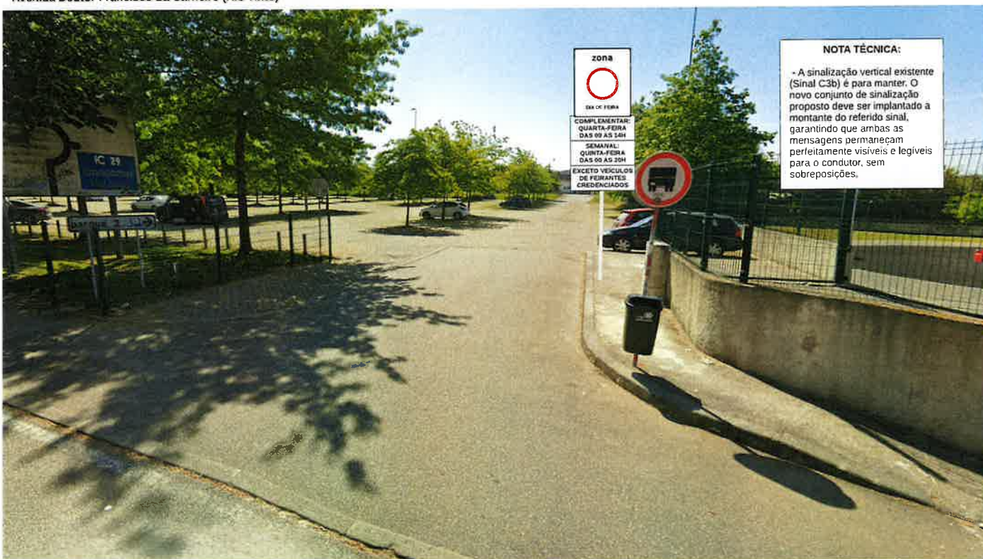
Feira de Gondomar Avenida Multiusos | Gondomar (São Cosme)

NOTA TÉCNICA: - A sinalização vertical existente (Sinal C3b) é para manter. O novo conjunto de sinalização proposto deve ser implantado a montante do referido sinal, garantindo que ambas as mensagens permaneçam perfeitamente visíveis e legíveis para o condutor, sem sobreposições.