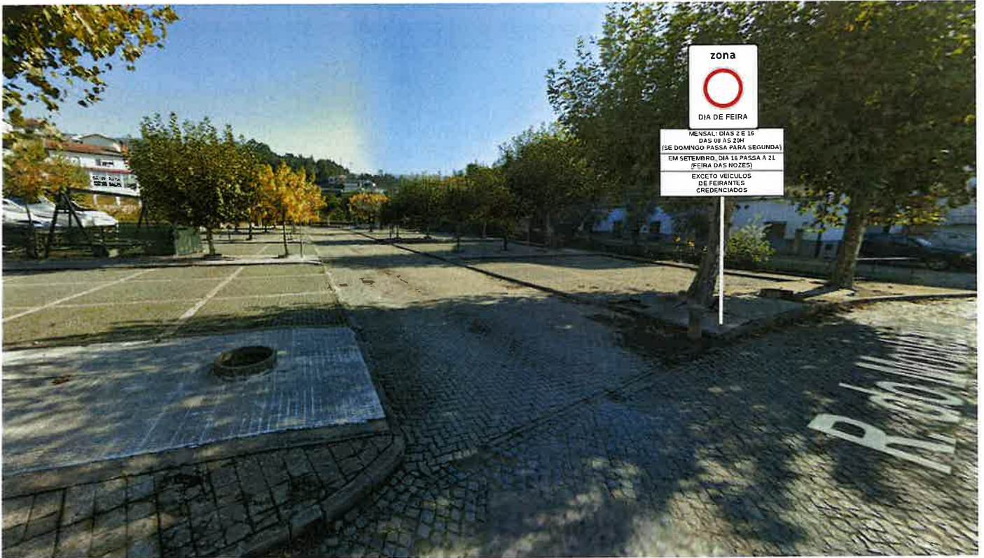
Feira de Melres Lugar de Quintãs (Melres)

Lugar de Quintãs (Melres) + Rua da Associação Desportiva de São Pedro da Cova (São Pedro da Cova) Planta nº 3